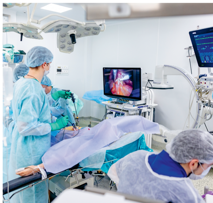
Флагманский центр ГКБ им. В.В. Вересаева

– Какие профилактические обследования проводятся в столице по онкологическому профилю?