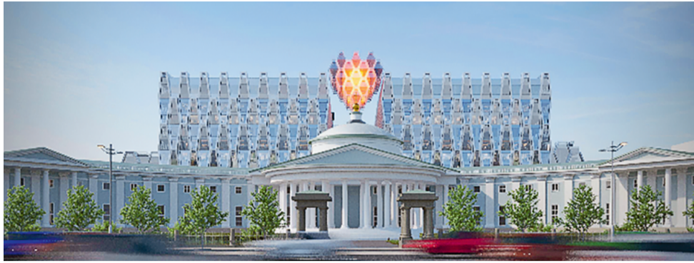
НИИ скорой помощи им. Н.В. Склифосовского в ближайшем будущем