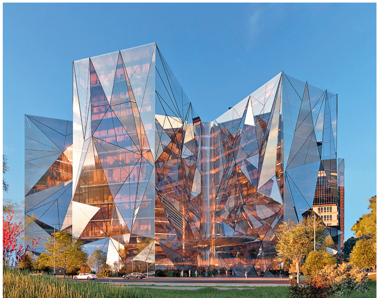
Городская клиническая больница имени В.П. Демихова в ближайшем будущем

ляется всё новое оборудование мирового уровня, больничное меню разработано в ресторанной концепции, а немедицинскую помощь окажут социальные координаторы.